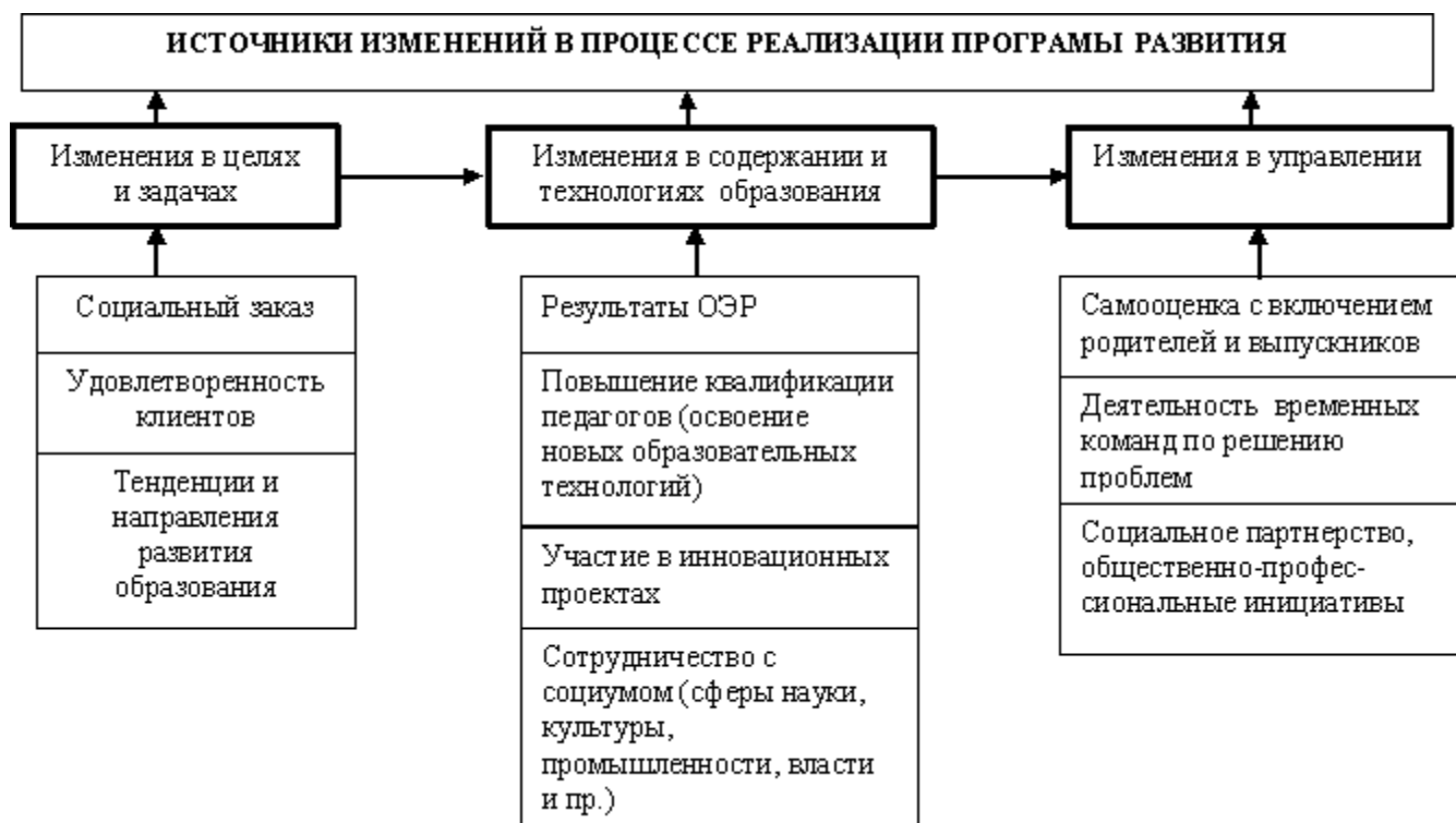
Рис. 1. Источники изменений в процессе развития образовательной системы ОУ.

2.3. Способы реализации целей и достижения результатов. Программа развития ориентирована на специфические изменения в образовательной системе лица на разных ее уровнях – стратегическом (цели и задачи), собственно образовательном (содержание образования, технологии, организационно-педагогические условия), управленческом. Изменение каждого из трех компонентов системы осуществляется исходя из определенных законодательных требований, результатов, полученных в ходе экспериментальной работы, участия в инновационных проектах, данных мониторинга, положительного опыта предшествующей деятельности. Конкретно эти источники изменений показаны на схеме 1: